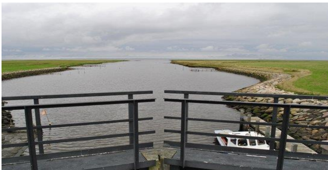
Udsigt over Vadehavet