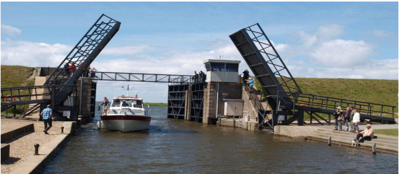
Indsejlingen gennem sluseportene