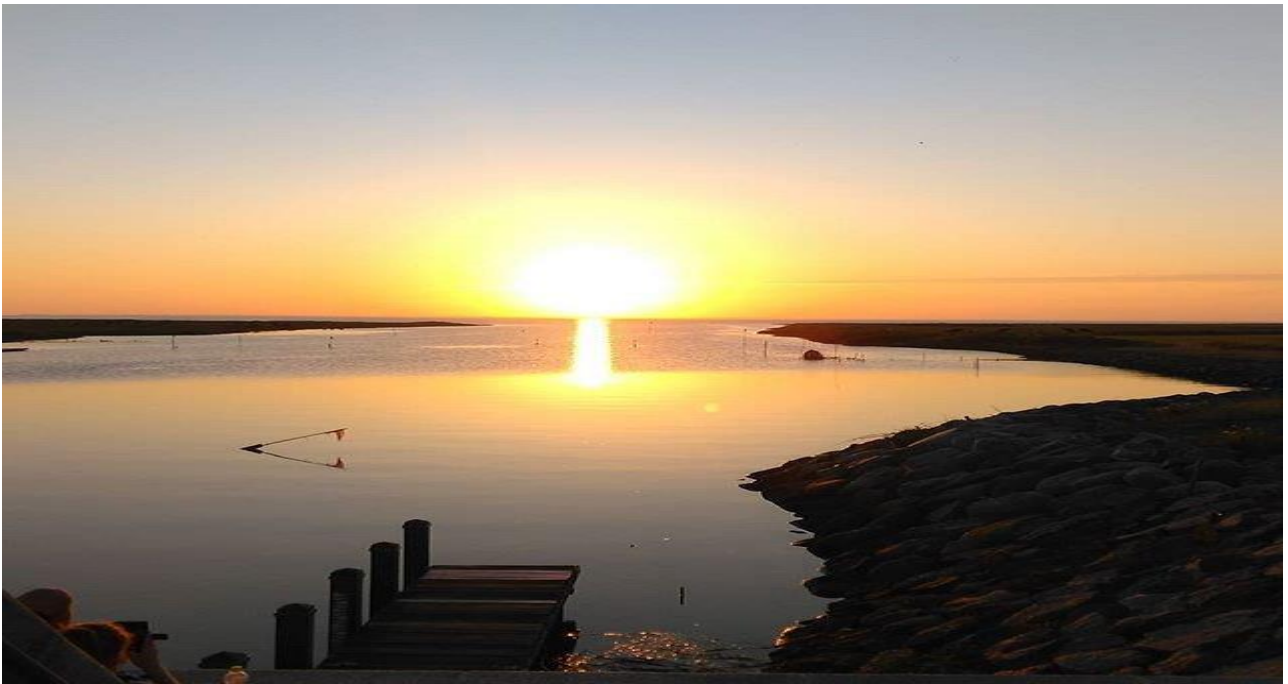
Udsigt over Vadehavet fra digekronen